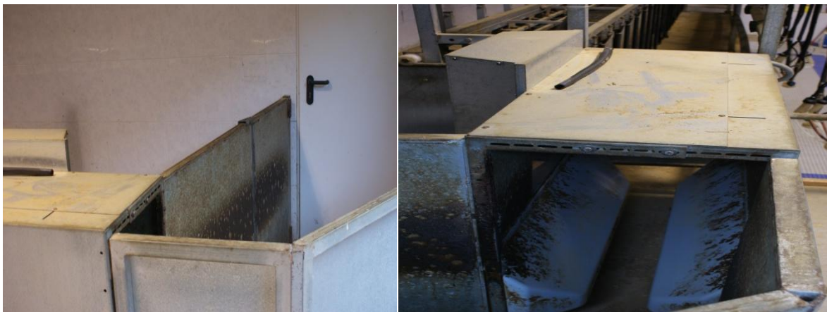
Lote nº 5: Amarres (20 plazas).